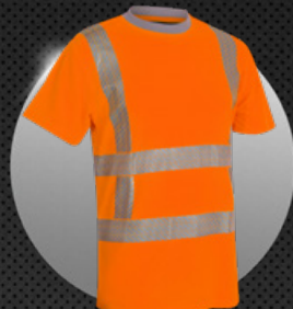
X-VIZ-FLEX 6200 RWS