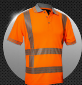
X-VIZ-COMFORT 6210 RWS