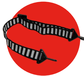
KAMPALA 8200 Art. nr. 6.78.200.00