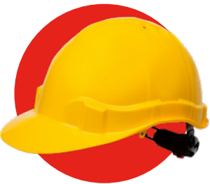
ASMARA 8050 Art. nr. 6.78.052.00