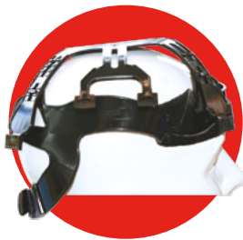
KINGSTON 8210 Art. nr. 6.78.210.00