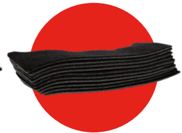
KIGALI 8205 Art. nr. 6.78.205.00