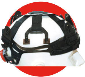
OTTOWA 8220 Art. nr. 6.78.220.00