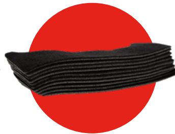
KIGALI 8205 Art. nr. 6.78.205.00