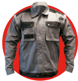
ERICK 2263 Art. nr. 2.22.263.00