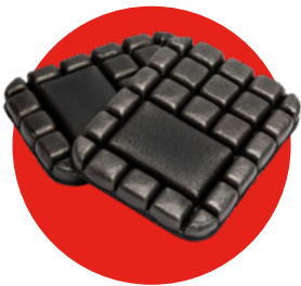
ELIDA 2358 Art. nr. 2.12.358.02