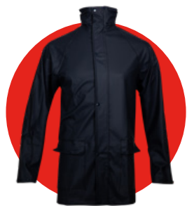
WALAKA 5200 Art. nr. 2.45.200.00