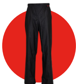
WARWICK 5300 Art. nr. 2.45.300.00