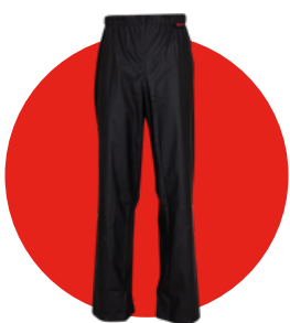
WARWICK 5300 Art. nr. 2.45.300.00