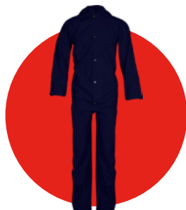
WARONA 5400 Art. nr. 2.45.400.00