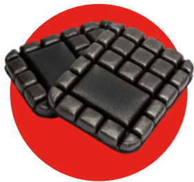
ELIDA 2358 Art. nr. 2.12.358.02