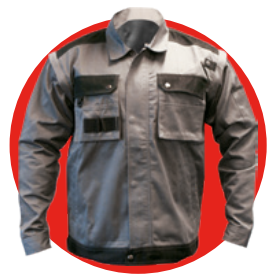
ERICK 2263 Art. nr. 2.22.263.00