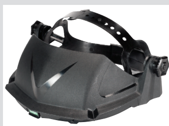
V-Gard Headgear Standaard