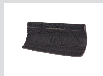
Verwisselbare zweetband voorhoofd