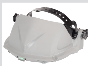
V-Gard Headgear Hogere Temperatuur