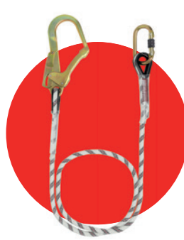
HAYES 4083 Positioneringslijn XL 2 m Art. nr. 8.84.083.00