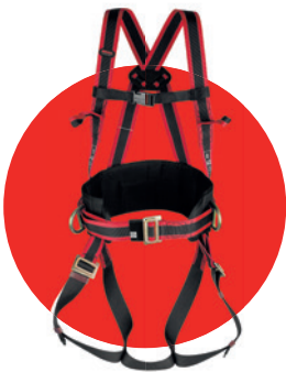
4012 HARNAS 5D Harnas 5D Art. nr. 8.84.012.00