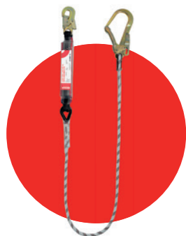
EIGER 4061 Vanglijn XL met valdemper 2 m Art. nr. 8.84.061.00