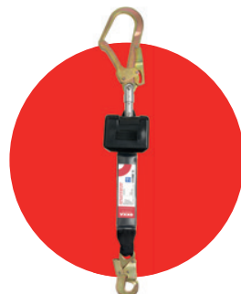
TAUNUS 4170 Valstopapparaat XL met valdemper 2,5 m Art. nr. 8.84.170.00