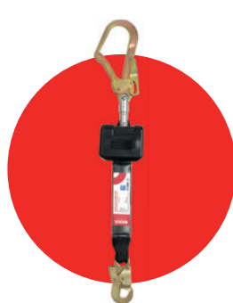
TAUNUS 4170 Valstopapparaat XL met valdemper 2,5 m Art. nr. 8.84.170.00