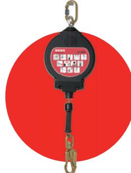
MIKENO 4177 Valstopapparaat met staalkabel 15 m Art. nr. 8.84.177.00