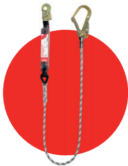
EIGER 4061 Vanglijn XL met valdemper 2 m Art. nr. 8.84.061.00