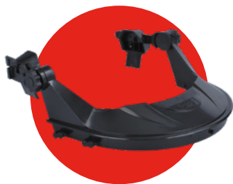
COLIMA 8510 Art. nr. 7.78.510.00