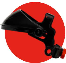
CASITA 8500 Art. nr. 7.78.550.00