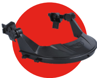
COLIMA 8510 Art. nr. 7.78.510.00