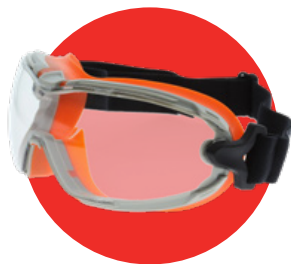
X-VIEW-COMFORT 8240 Art. nr. 7.78.240.00