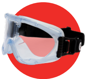
EGON 8226 Art. nr. 7.78.226.00