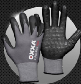
X-PRO-FLEX PLUS 51-295 Art. nr. 1.51.295.00