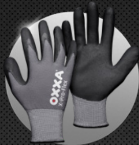
X-PRO-FLEX 51-290 Art. nr. 1.51.290.00