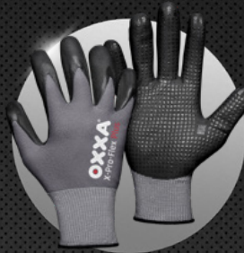
X-PRO-FLEX PLUS 51-295 Art. nr. 1.51.295.00