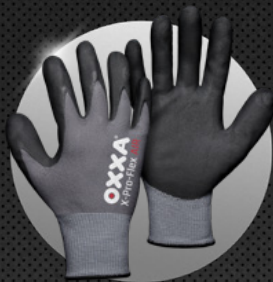
X-PRO-FLEX AIR 51-292 Art. nr. 1.51.292.00