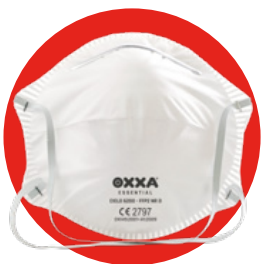
CIELO 6200 Art. nr. 4.05.620.00