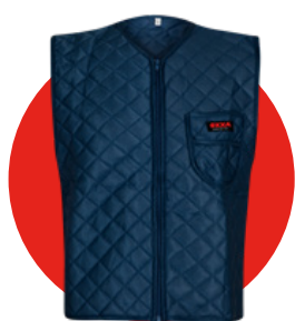
RABECA 2170 Art. nr. 2.52.170.00