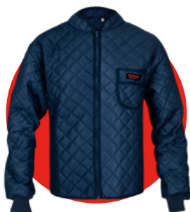
RAFAEL 2070 Art. nr. 2.52.070.00