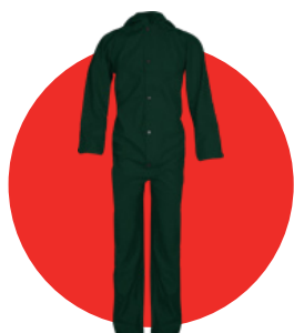
WARONA 5400 Art. nr. 2.45.415.00