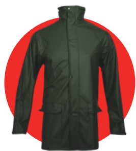
WALAKA 5200 Art. nr. 2.45.215.00