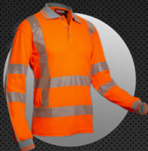
X-VIZ-COMFORT-LONG 6220 RWS